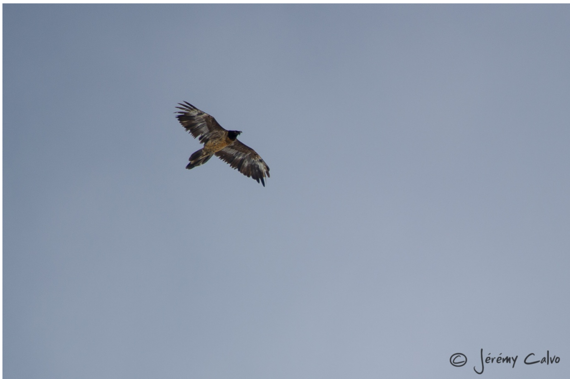
Immature observé à Frioland

32 observations d'aigles royaux ont été dénombrées. Aucun Vautour fauve n'a été observé.